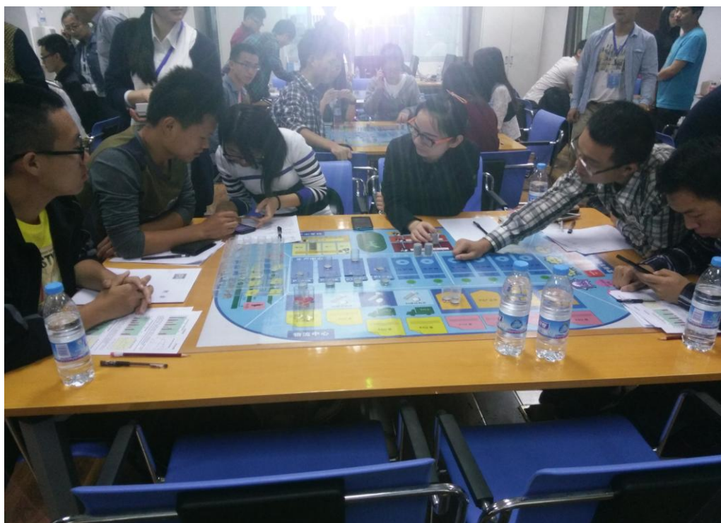
图 2. 各参赛团队激烈比拼现场