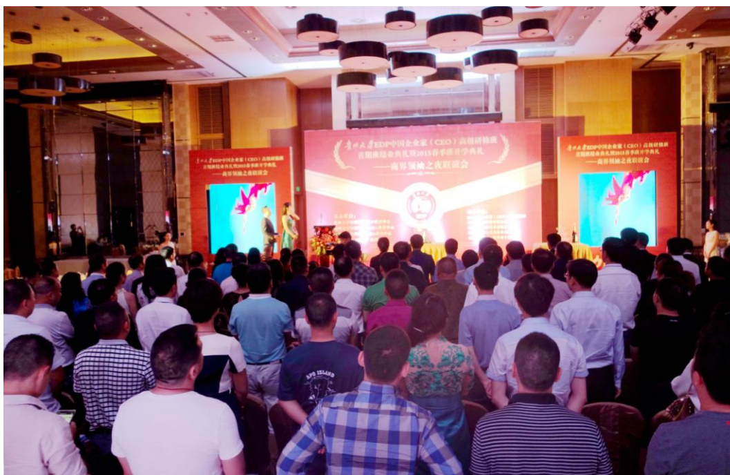
贵州大学 EDP 开学典礼暨 EDP 首期班结业典礼仪式

打造黔商领袖，助力区域经济。2015 年 5 月 30 日，由贵州大学管理学院 EDP 教育中心、MBA 教育中心、EMBA 教育中心、中国网·中国品牌·品牌贵州共同主办的 2015 贵州大学 EDP 春季中国企业家（CEO）高级研修班开学典礼暨 2013 贵州大学 EDP 首期班结业典礼——“商界领袖之夜联谊会”在金阳万丽酒店隆重举行。贵州大学常务副校长王红蕾、贵州大学副教务长杜滨、贵州大学管理学院党委书记陶玉顺、院长李焯等领导以及 2013 贵州大学 EDP 首期班、2015 春季中国企业家高级研修班学员近 200 人参加出席典礼仪式。