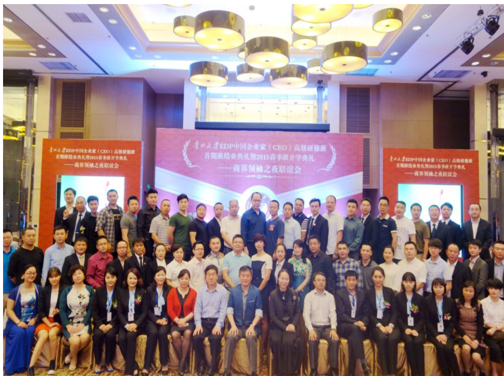
EDP 一、二、三班学员与校、院领导师生合影留念