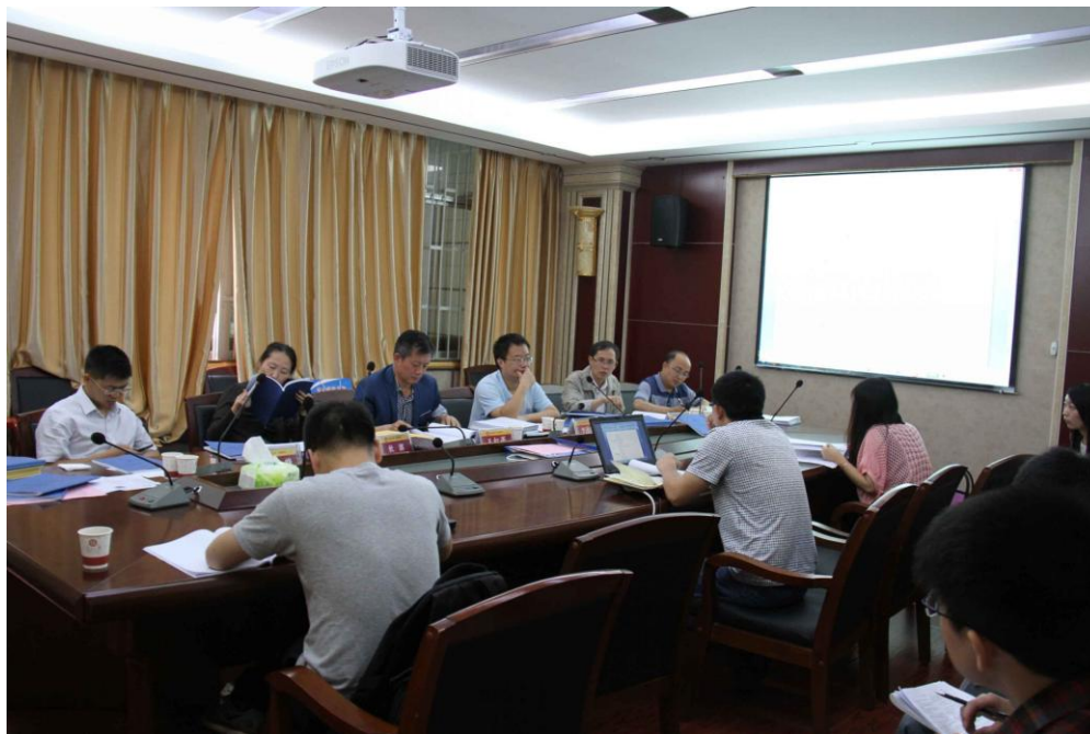
图 2. 管工一组答辩现场

此次毕业论文答辩是 2012 级硕士研究生增长知识，交流信息的过程；也是他们全面展示自己的勇气、才能、智慧、风度和口才的最佳时机之一；是向答辩委员有关专家学习、请求指导的好机会；更是对毕业生们为期三年学习成果的检验。另外，在领导和各组答辩委员的共同努力下，毕业生论文答辩工作的顺利结束。这也是对我院研究生培养工作的一次综合评价和肯定。