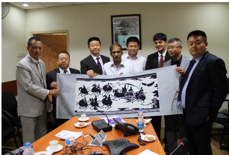
图10 桑巴希瓦·拉奥，市政管理和城市发展部部长（安得拉邦）