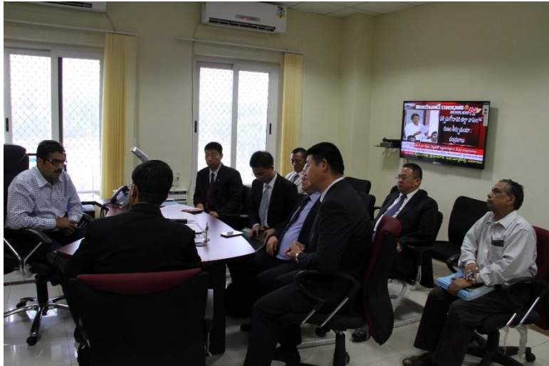
图8 桑杰·贾维，信息产业和电子通讯部部长（安得拉邦）