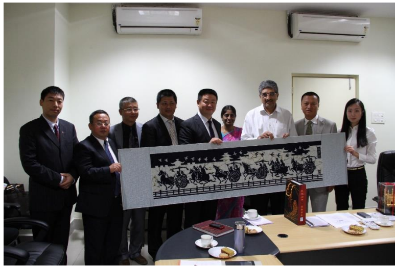
图 6 普拉萨德 工业与商业部部长（安得拉邦）