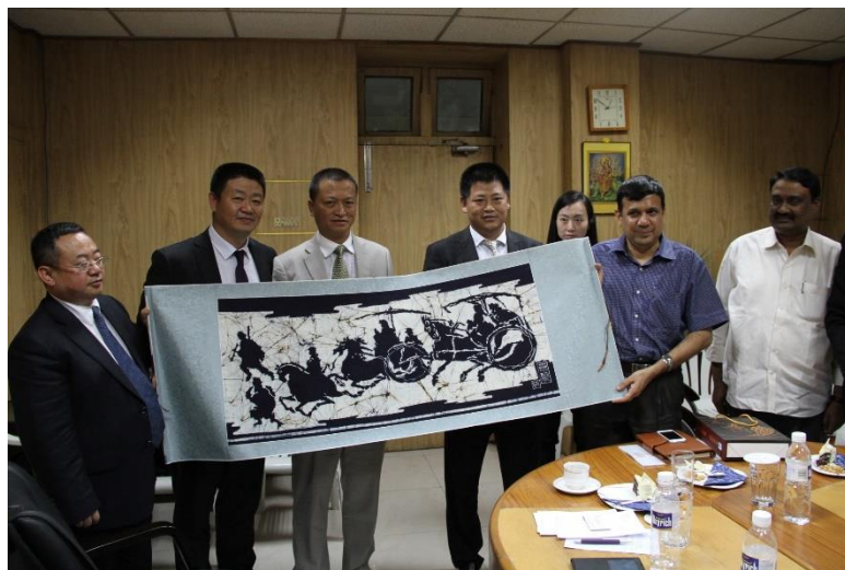
图 7 阿杰伊·基恩，能源部部长（安得拉邦）